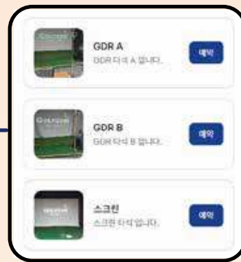
[모바일 예약 시스템]